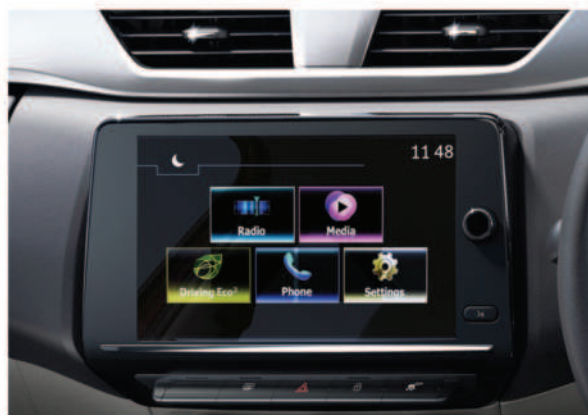
20.32 cm టచ్ స్క్రీన్ mediaNAV ఇవాల్యూయేషన్