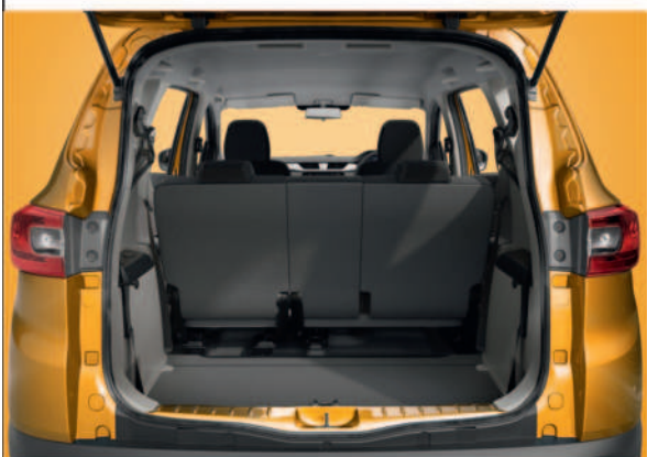
625L వరకు బూట్ స్పేస్

EMI మొదలు ₹7 999/- కే* లాభాలు ₹50 000/- వరకు#