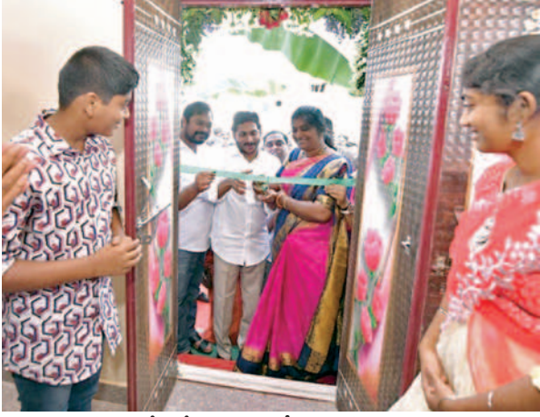
గురువారం సామర్లకోటలో ఇళ్ల గృహప్రవేశాలను ప్రారంభిస్తున్న సిఎం జగన్