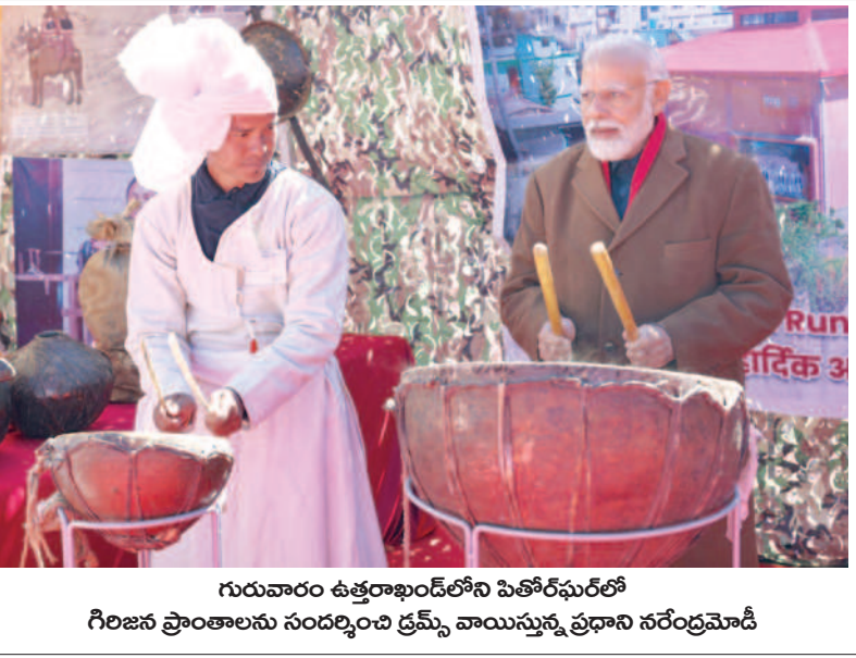
గురువారం ఉత్తరాఖండ్ లోని పిఠోరిఘాట్ లో గౌరవ ప్రాంతాలను సందర్శించే డ్రమ్స్ వాయిస్తున్న ప్రధాని నరేంద్రమోడీ