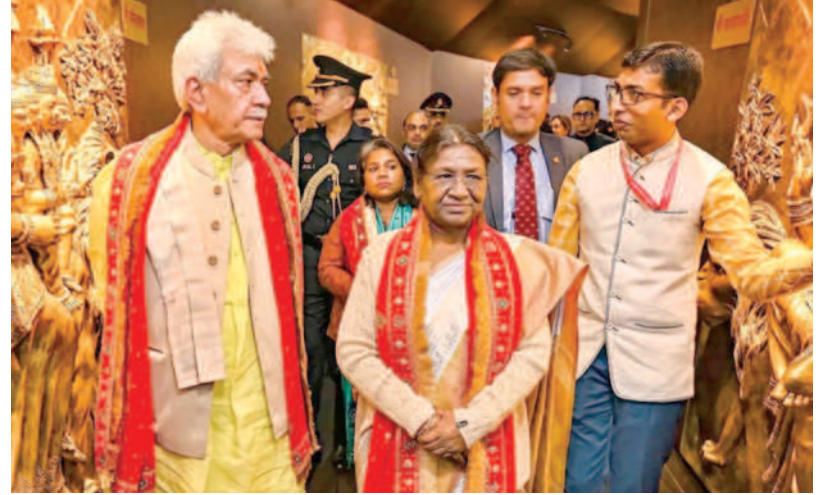
గురువారం మాతా వైభోదేవి ఆలయాన్ని రాష్ట్రపతి ముప్పై సంవత్సరాల వ్యక్తిగతంగా