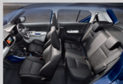
Spacious and Comfortable Interiors