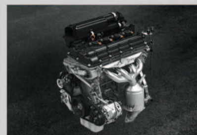
1.2L VVT Petrol Engine

NEXA Safety Shield ■ SUZUKI-TECT BODY ■ DUAL FRONT AIRBAGS ■ ESP ■ SEAT BELT PRE-TENSIONERS WITH FORCE LIMITERS ■ ISOFIX CHILD SEAT ANCHORAGES ■ PEDESTRIAN PROTECTION COMPLIANCE ■ COMPLIANT WITH - - FULL FRONTAL IMPACT - FRONTAL OFFSET IMPACT - SIDE IMPACT