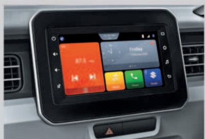
17.78 cm SmartPlay Studio (Available from Zeta variant onwards)

Scan the QR code to chat with us on WhatsApp.