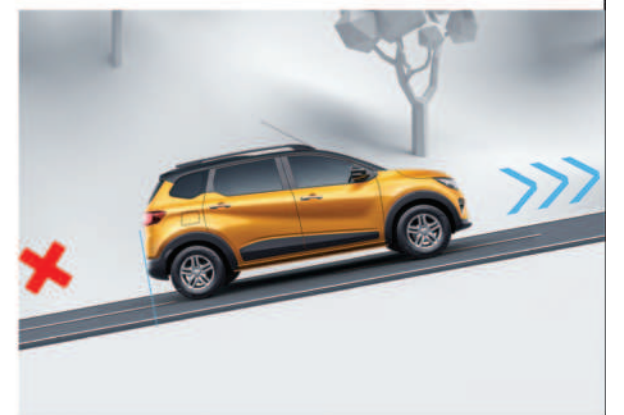
హిల్ స్టార్ట్ అసిస్ట్ (HSA)

for a test drive, call on 1800 315 4444. select variants available in CSD. special offers for defence personnel, government, PSU and corporate employees. for bulk enquiries, contact corpsales@renault.com for further details, connect on www.renault.co.in