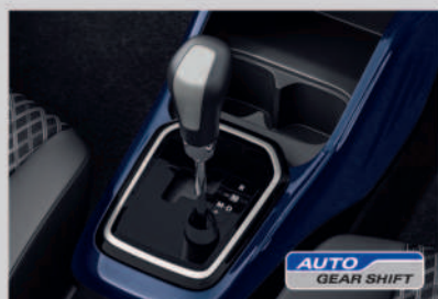
Auto Gear Shift