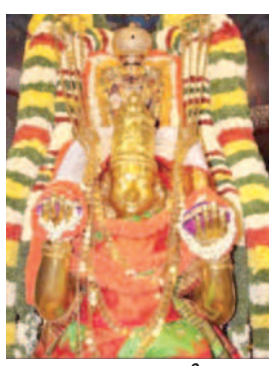
గరుడు వాచానం పై శ్రీ వారు ప్రార్థన

తిరుపతి, అక్టోబర్ 12, ప్రభాతవార్త ప్రతినది: తిరుమల శ్రీ వారి ఆలయంలో అక్టోబరు 15 నుండి 23వ తేదీ వరకు జరుగుతున్న నవరాత్రి బ్రహ్మాత్మనాల్లో భాగంగా అక్టోబరు 19న జరుగుతున్న గరుడ వాచాన సేవ దర్శనాన్ని ఎక్కడ మంది భక్తులకు కల్పించాలనే ఉద్దేశంతో రాత్రి 7 గంటలకు బదులుగా సాయంత్రం 6.30 గంటలకు ప్రారంభించాలని టీడీపీ నిర్ణయించింది. అదే విధంగా ఎక్కడ మంది సామాన్య భక్తులకు మూలమూర్తి దర్శనం కల్పించేందుకు వీలుగా ఆర్థిక సేవలు, ప్రత్యేక దర్శనాలు టీడీపీ రద్దు చేసింది. స్వామి వారికి ఆత్మీక ప్రీతిపాత్రమైన గరుడవాచనం దర్శించుకునేందుకు వేలాది మంది భక్తులు ముందురోజు నుండి గొల్లాలిలో నిరీక్షిస్తున్నారు. వారి సౌలభ్యం మేరకు టీడీపీ ఈ నిర్ణయం తీసుకుంది. ఆగమశాస్త్రం ప్రకారం సూర్యాస్తమయం తరువాత రాత్రి వాచానం నిర్వహిస్తారు. కాగా అక్టోబర్ 19న సాయంత్రం 6.15 గంటలకు సూర్యాస్తమయం అవుతుంది. ఆ తరువాత సాయంత్రం 6.30 గంటలకు గరుడవాచన ప్రారంభమవుతుంది. గతంలో రాత్రి 9 గంటలకు గరుడవాచన ప్రారంభమవుతుండగా, ఆ సమయాన్ని రాత్రి 7 గంటలకు మార్చారు ప్రస్తుతం ఆగమ సలహామండలి నిర్ణయం మేరకు గరుడవాచన సమయాన్ని ఆరగంట ముందుకు మార్చడం జరిగింది. కాగా బ్రహ్మాత్మనాల్లో ఎక్కడ మంది సామాన్య భక్తులకు దర్శనం కల్పించేందుకు వీలుగా ఆర్థిక సేవలు, ప్రత్యేక దర్శనాలు టీడీపీ రద్దు చేసింది. ఆలయంలో అభ్యుదయ పాఠశాల ప్రారంభం, తిరుప్పావన, కల్యాణోత్సవం, ఊంజల్ సేవ, సహాధ్యక్షులారా సేవలను టీడీపీ రద్దు చేసింది. ముందున్న ఆర్థిక బ్రహ్మాత్మనం సేవ టీడీపీ బుక్ చేసుకున్న భక్తులకు నిరీక్షిత వాచానం సేవ అనుమతిస్తారు. అక్టోబరు 14న అలకరాధుని కారణంగా సహాధ్యక్షులారా సేవను టీడీపీ రద్దు చేసింది.