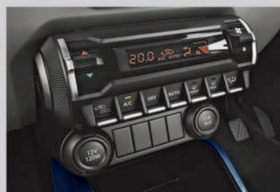
Automatic Climate Control